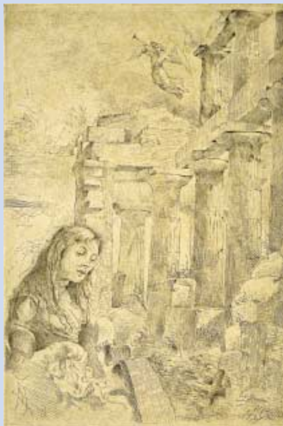
1. Zbigniew Herbert, „Widok Akropolu”, rysunek w szkicowniku z podróży do Grecji w 1975 r. 2. Cyprian Norwid, „Na cmentarzu (Alleluja!)”

„ Wkrótce uświadomiłem sobie, że istnieją we mnie dwa Akropol: dzienny i nocny. Pierwszy był analityczny, z głową w przewodniku. Sprawdzanie planu, badanie struktury całości, dotykanie kamieni, wyobrażanie sobie tego, co zginęło – trochę jak studium anatomii wykopaliskowego zwierza.