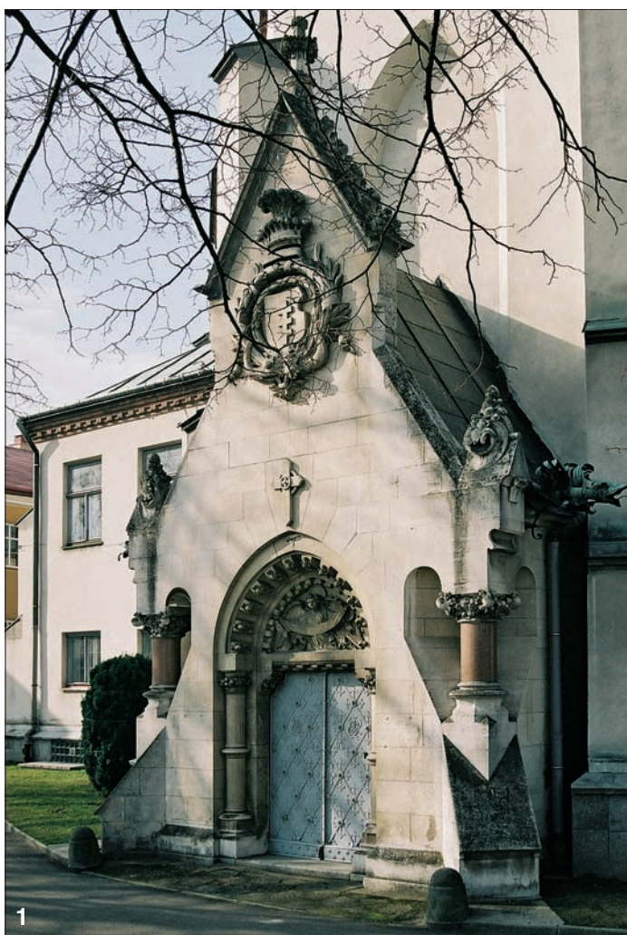
1. Mauzoleum Potockich w Łańcucie

Sprowadził je z Wiednia do Łańcuta w 1885 r. prawnuk, II ordynat – Alfred Potocki. Nie wiadomo, czyje szczątki kryje przypisywana jej trumna.